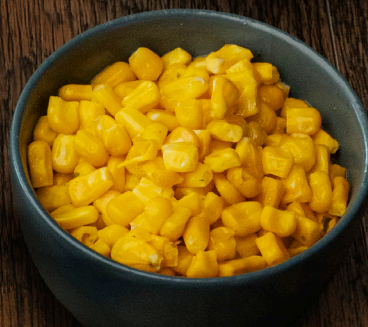
ELOTES A LA MANTEQUILLA