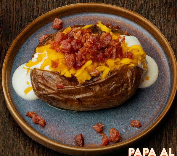
PAPA AL HORNO