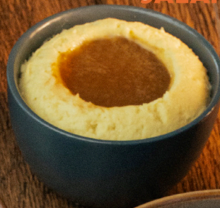
PURÉ DE PAPA JALAPEÑO