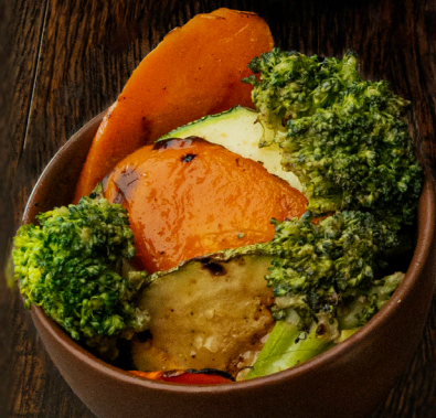
VEGETALES A LA PARRILLA