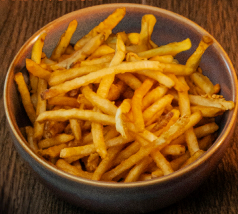
PAPAS A LA FRANCESA