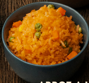
ARROZ A LA MEXICANA