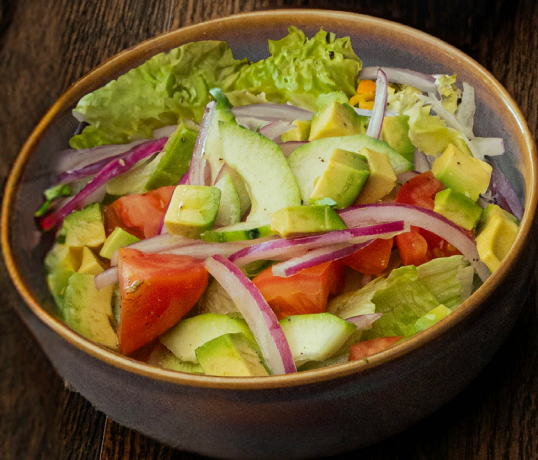
ENSALADA DE LA CASA